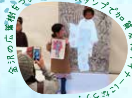
金沢の広葉樹をつかった木のスタンプで加賀友禅が木からあそぼう！