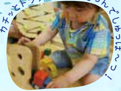
カチッとトラックに荷物をつんでしまおう！