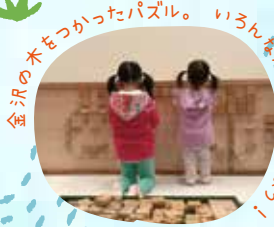
金沢の木をつかったパズル。いろんな形をつくらせてみるよ！