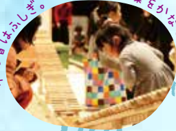
木のおもちゃはあそび。ころころと音楽をかかえます。