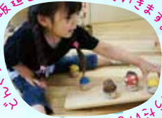
木琴が家族が坂道をカタカタおりにいきます。