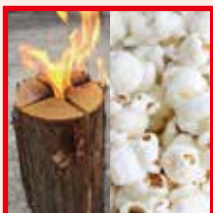
県民木づかい推進大会 木材を燃料にしたポップコーン作り体験、非常用料理。