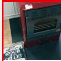
ペレットストーブ