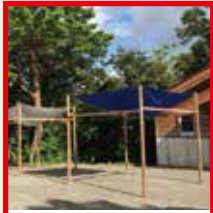
マルテン 県産間伐材を使ったテント。