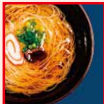
そう麺つるゝ 新しいそう麺に気づく。