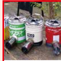
ロケットストーブ